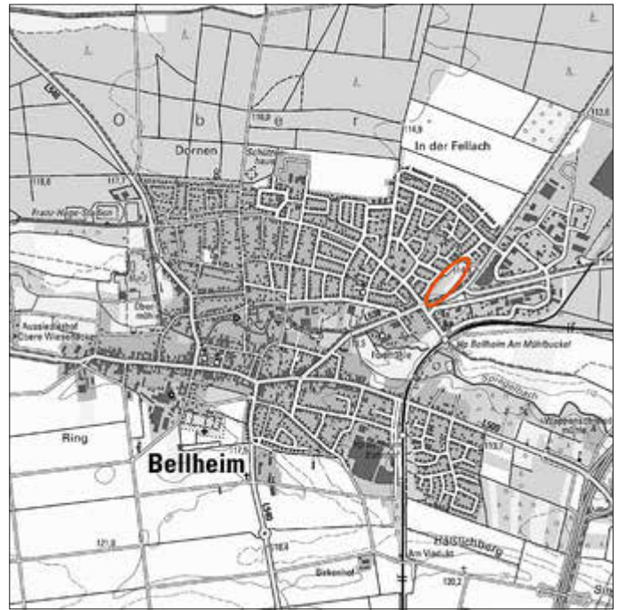
Lage des Plangebiets

Der Bebauungsplan soll im beschleunigten Verfahren ohne Durchführung einer Umweltprüfung nach § 2 Abs. 4 BauGB aufgestellt werden.