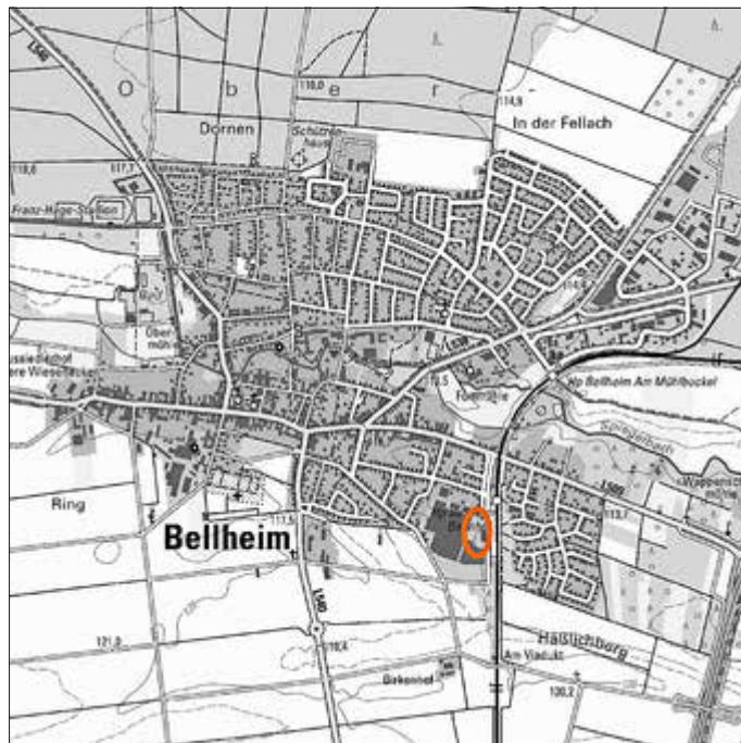
Lage des Plangebiets

Die Öffentlichkeit kann sich in der Bauabteilung der Verbandsgemeindeverwaltung über die allgemeinen Ziele und Zwecke sowie die wesentlichen Auswirkungen der Planung unterrichten; vorherige Terminvereinbarung wird empfohlen (Kontakt: Herr Guz, Tel. 07272/7008-401).