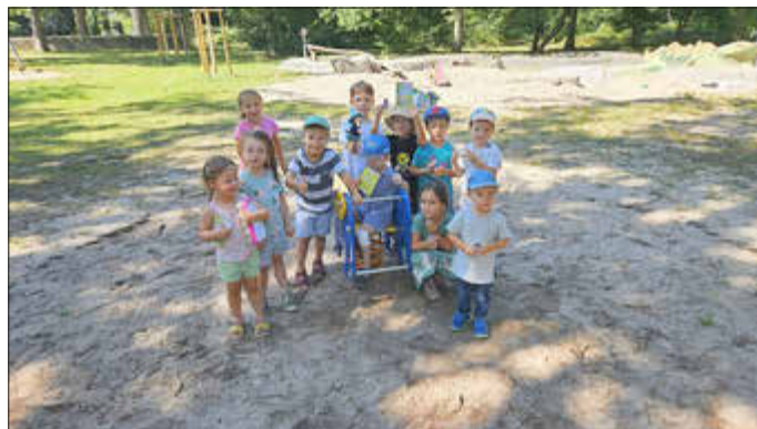
Wir alle haben die gemeinsame Zeit sehr genossen und freuen uns auf viele weitere Abenteuer!

Auf ging's zum Walderlebnispfad. Dort mussten Waldschätze gefunden werden. In einem Eierkarton waren Waldschatzkarten befestigt. Die Kinder machten sich eifrig auf die Suche nach Blättern, Rinde, Moos, Schneckenhäusern und anderen Dingen und bald war auch diese Aufgabe geschafft. Die Schatzkisten durften dann selbstverständlich behalten und mitgenommen werden. Willi hatte noch eine letzte Aufgabe, wozu die Schätze gut zu gebrauchen waren. Die Kinder durften bei der letzten Aufgabe ganz kreativ sein. Aus Ton formten sie wunderbare Waldgeister, die guten Seelen des Waldes. Am Waldweg entlang kann man nun viele, wunderschöne Waldgeister bestaunen.