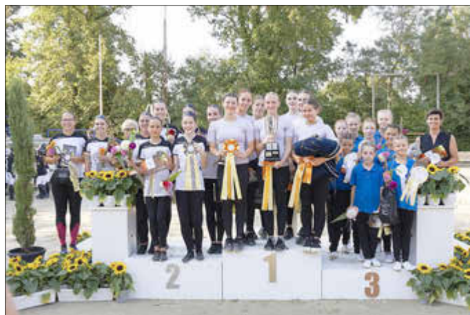
Meister im Voltigieren

Wir blicken auf ein gelungenes Wochenende in Zeiskam zurück und freuen uns auf mehr!