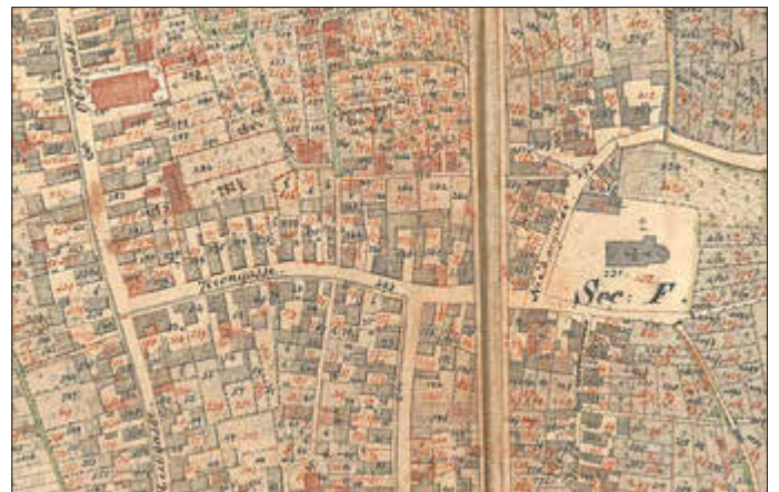
Ortsplan von 1840 mit kath. Kirche und geplanter evang. Kirche sowie das projektierte Rathaus

Umso erstaunlicher ist es deshalb, dass 1755 gemeinsam die heutige katholische Kirche erstellt wurde. Über dem Hauptportal ist zu lesen: „Catholici et Reformati has aedes pariter erigebant“. Die mittlerweile wieder katholisch gewordenen Kurfürsten hatten dem alten Glauben inzwischen wieder die freie Ausübung gewährt. Die kurpfälzische religionsdeklaration von 1705 bestimmte schließlich das Simultaneum, was die gemeinsame Nutzung eines Gotteshauses durch beide Konfessionen bedeutete. Der Chorraum wurde den Katholiken zugesprochen, das Langhaus den in den kurpfälzischen Gebieten zahlreicheren Protestanten. Nur in den zum Bistum Speyer gehörenden Regionen gab es eine katholische Mehrheit in der Bevölkerung. Auch bereits in der baufällig gewordenen Zeiskamer Vorgängerkirche hatte man die Aufteilung des Kirchenraums vollzogen. Mancherorts wurde, wie in der Neustadter Stiftskirche, sogar eine Mauer in den Kirchenraum eingezogen.