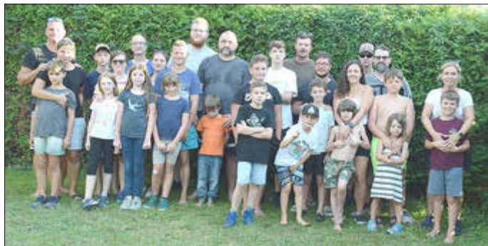
Die Gruppe vor dem Grillen in Leimersheim

tungen für das Grillen, sowie errichten des Nachtlagers. Nun wurde für das Lagerfeuer Holz gesammelt. Nach einem reichhaltigen Nachtessen ging es zum gemütlichen Teil über. Beim gemütlichen Abend wurde sich rege ausgetauscht und nach einer kurzen Nacht wurde am nächsten Morgen gemeinsam ein reichhaltiges Frühstück eingenommen. Gemeinsam bauten die Teilnehmer die Zelte ab und räumten alles auf.