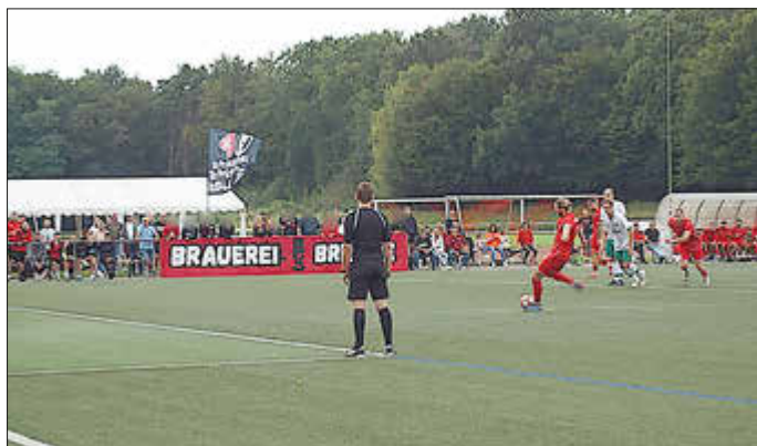
Pascal Gaschott beim erfolgreichen Elfmeter zum 1:0!