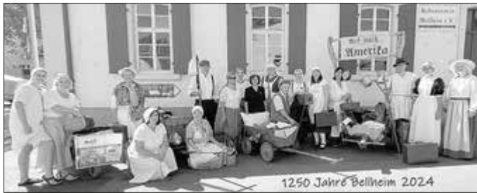
1250 Jahre Bellheim 2024

Bellheim – Im Rahmen der 1250-Jahr-Feier nahm Mixtur am Festtagsumzug unter dem Motto „Auf nach Amerika – Auswanderer um 1900“ teil. Dank der Unterstützung des Kulturvereins konnten wir historische Kostüme und Requisiten nutzen, die uns in die Zeit des Auswanderer-Aufbruchs versetzten.