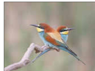
Originalbilder aus der Pfalz