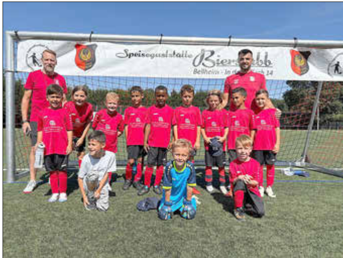
Die F2-Jugend zum Spiel gegen den TuS Knittelsheim II!

Bei sommerlichen Temperaturen traten unsere F2-Kids vom FC Phönix Bellheim im Klassiker gegen den TuS Knittelsheim II an. Nach dem Schlusspfiff auf dem Großfeld hatten unsere F2-Kickerinnen und Kicker, das Lokalderby für sich entschieden. Auch auf dem Kleinfeld waren Sie gegen die tapfer kämpfenden Jungs und Mädels des TuS Knittelsheim II erfolgreich.