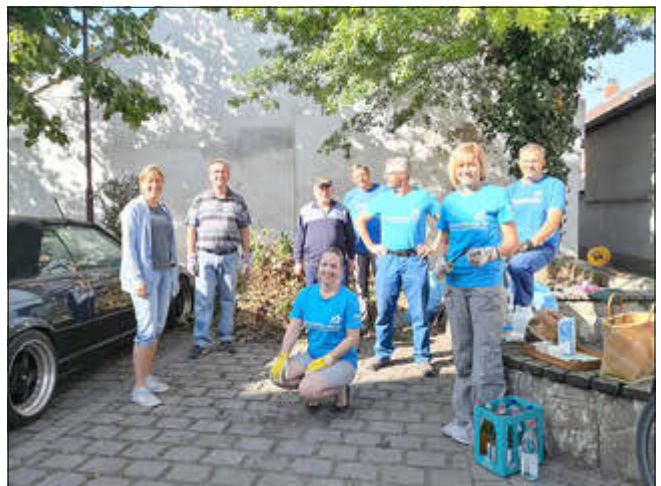
Unsere fleißigen Helfer bei einem der letzten Einsätze!