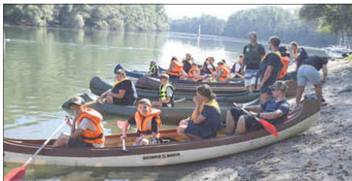
Alle Boote vor dem Start zur Kanutour